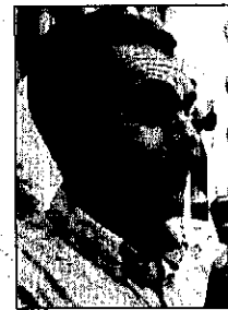
FRAY PASCUAL SATURIO

Su espectáculo Samsara lo concibió mientras se debatía entre la vida y la muerte en la mesa de operaciones. Para el coreógrafo es una de sus obras más especiales, en la que se ha volcado más tiempo del que acostumbra a hacer.