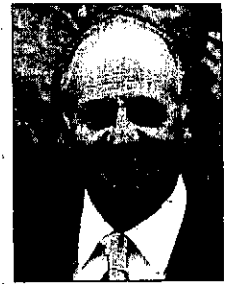
JUAN CARLOS I

Durante estos días se siguen celebrando actos con motivo de la festividad de la Patrona. Los más pequeños aprenden la historia de la Virgen del Rosario y realizan la tradicional ofrenda floral en el templo dominico.